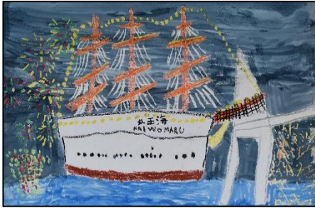
第29回小学生下学年の部 最優秀賞作品 「海王丸とナイアガラのコンビ」

■応募方法 令和8年7～8月までの夏季期間に描かれた「帆船海王丸」を題材とした絵画