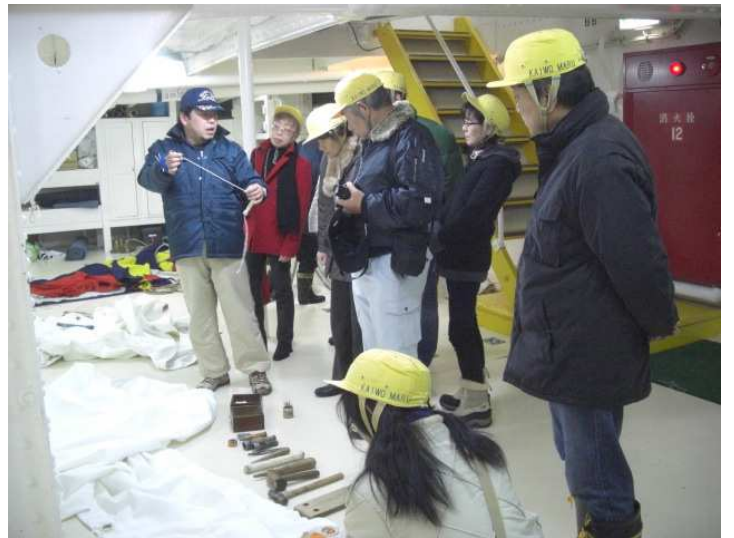
非公開区域の特別公開（作業場）