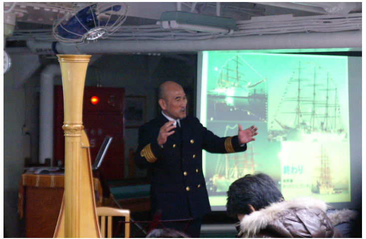
岡邊船長の『海王丸トリビア』