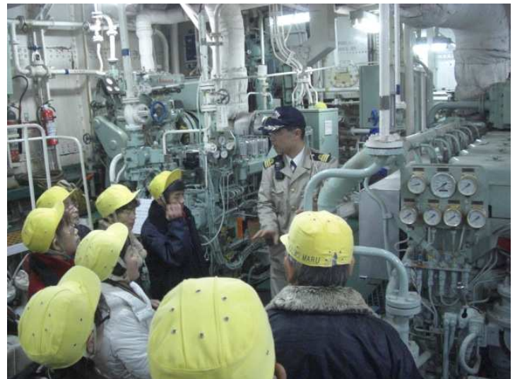
非公開区域の特別公開（機関室）