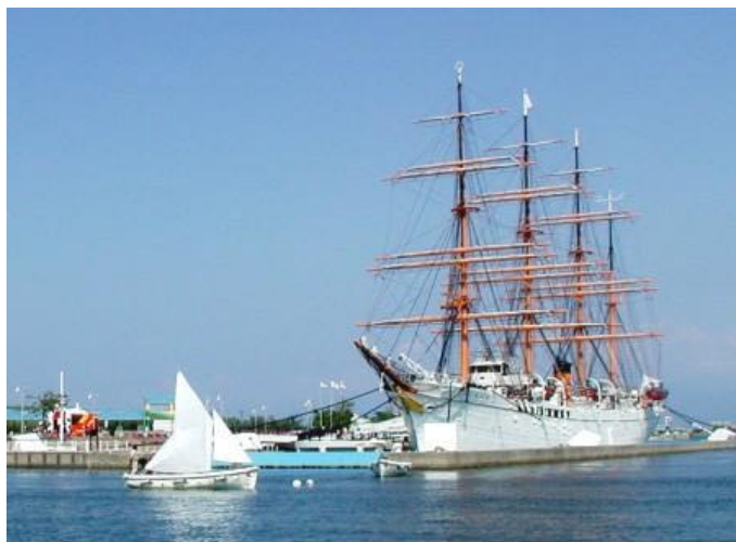
海王丸前でセイリング!

日時：平成21年 4月25日(土) 4月29日(祝) 5月3日(日) 5月5日(祝) 5月6日(祝) 午前 0900~1150 午後 1300~1550