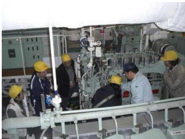
非公開区域の特別見学ツアー（機関室）