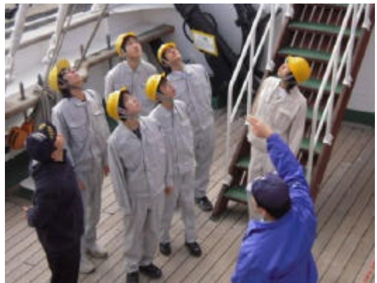
海事課職員の説明を聞く学生達