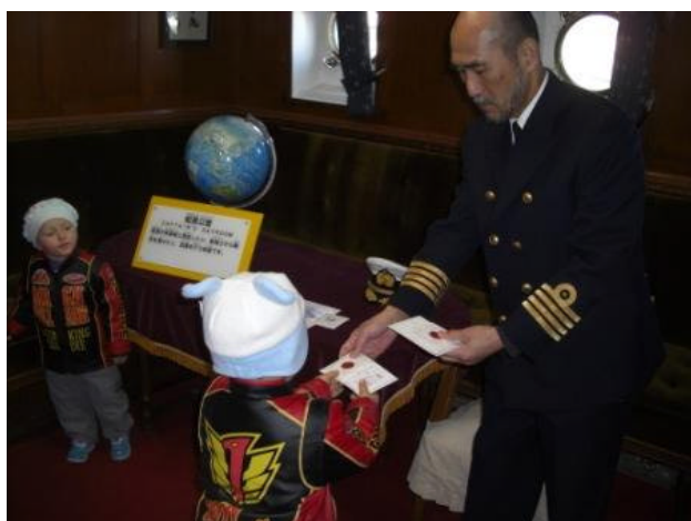
特製チョコレートのプレゼント