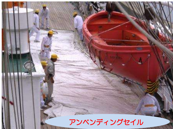
アンベンディングセイル

11月5日(土) ボランティア19名の協力を得て、セイルの取り外し作業を行いました。皆さんの協力のおかげで予定よりも早く作業を終える事が出来ました。その後、マスト等の塗装も行い、海王丸の冬支度は万全です。新しい塗料で生まれ変わった海王丸をぜひ見に来て下さい。