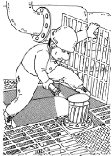
ポンプのグラウンド部からの水漏れ点検。