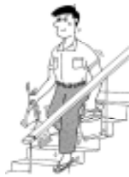
足が滑ると転倒する危険があります。