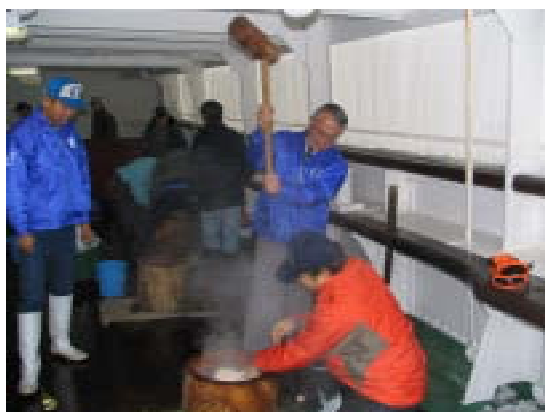
昨年の餅つき大会の様子

毎年恒例の餅つき・鏡開き大会を、下記の日程で開催します。ボランティアの皆さんのご協力が必要です。冬季のボランティア親睦の場でもあります、沢山の方のお越しをお待ちしております。